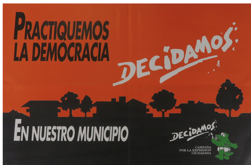
Figura 2. IVc 27206 – “Practiquemos la democracia. Decidamos en nuestro municipio”. 40cm x 61 cm. Paraguay. (Foto: MKB).

por eso, la mayoría de estos son más figurativos en su forma y menos abstractos que en los otros modelos descritos (ibíd.: 16). Estos affiches se caracterizan por alcanzar un sincretismo de sus influencias visuales que van desde el pop-art 4 , al cartel cubano 5 o a la serigrafía 6 monocromática (Villena 2022: 120). Para el diseño de los carteles políticos y sociales podemos encontrar hasta tres formas de elaboración de los mismos: exclusivamente un texto, que sirve de explicación o argumento sobre el hecho al que se hace referencia. También es posible tener únicamente la presentación de una imagen, que es capaz de ilustrar un estado o una situación determinada y además hay veces que en los pósters vemos una combinación entre texto e imagen (Artiger 2000: 17).