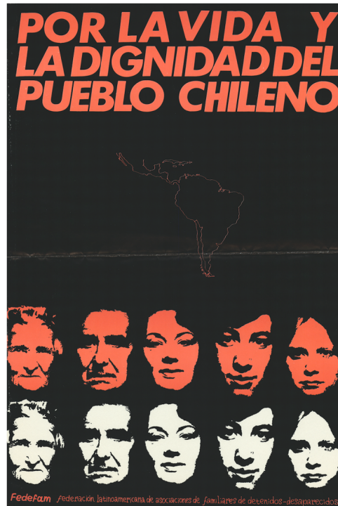
Figura 5. IVc 27175 – “Por la vida y la dignidad del pueblo chileno”, 48cm x 35 cm. Chile.