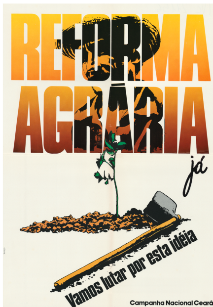
Figura 3. IVc 27156 – “Reforma agraria Ja! Vamos lutar por esta ideia” 1986, 63cm x 43cm. Brasil.

Se entiende por movimiento de resistencia a la acción conjunta, voluntaria y coordinada que surge de un conflicto. Son necesarios dos o más individuos que buscan, a través de unas determinadas prácticas de movilización, la defensa de unos intereses comunes que pueden ser desde económicos, políticos o territoriales la consecución de un bien público, hasta el planteamiento de un cambio social (Jiménez Montero 2010: 704).