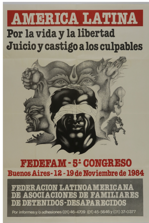
Figura 6. IVc 27215 – “America Latina. Por la vida y la libertad. Juicio y castigo a los culpables. 1984, 74cm x 54cm. Argentina. (Foto MKB).