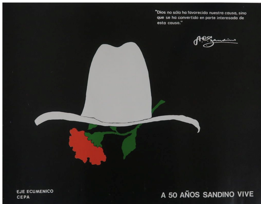
Figura 1. IVb 6606 – “A 50 años Sandino vive”. 1984, 53cm x 42 cm. Nicaragua.

las conocieran (ibíd.: 18). Hubo dos circunstancias que revolucionaron la idea del cartel en la historia: el primero fue la invención del papel en China y lo liviano y económico de las láminas de este material. Lo segundo fue la concepción de la imprenta en Europa en el siglo XV. Además los acontecimientos políticos y sociales que sucedieron durante los siglos XIX y XX favorecieron el auge de este medio de comunicación, haciendo que este se volviera universal y cotidiano (Juárez Garduño 2022).