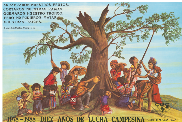
Figura 4. IVb 6603 – “1978-1988: Diez años de lucha campesina en Guatemala” 1988, 68cm x 45cm. Guatemala.