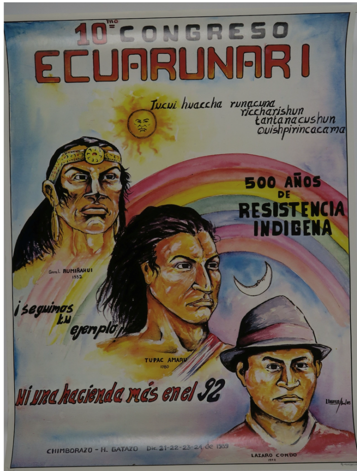
Figura 10. IVc 27193 – “10º Congreso ECUARUNARI. 500 Años de resistencia indígena”, 58cm x 35cm. Ecuador.

IVc 27193 – Póster que representa la resistencia de los pueblos originarios de Ecuador.