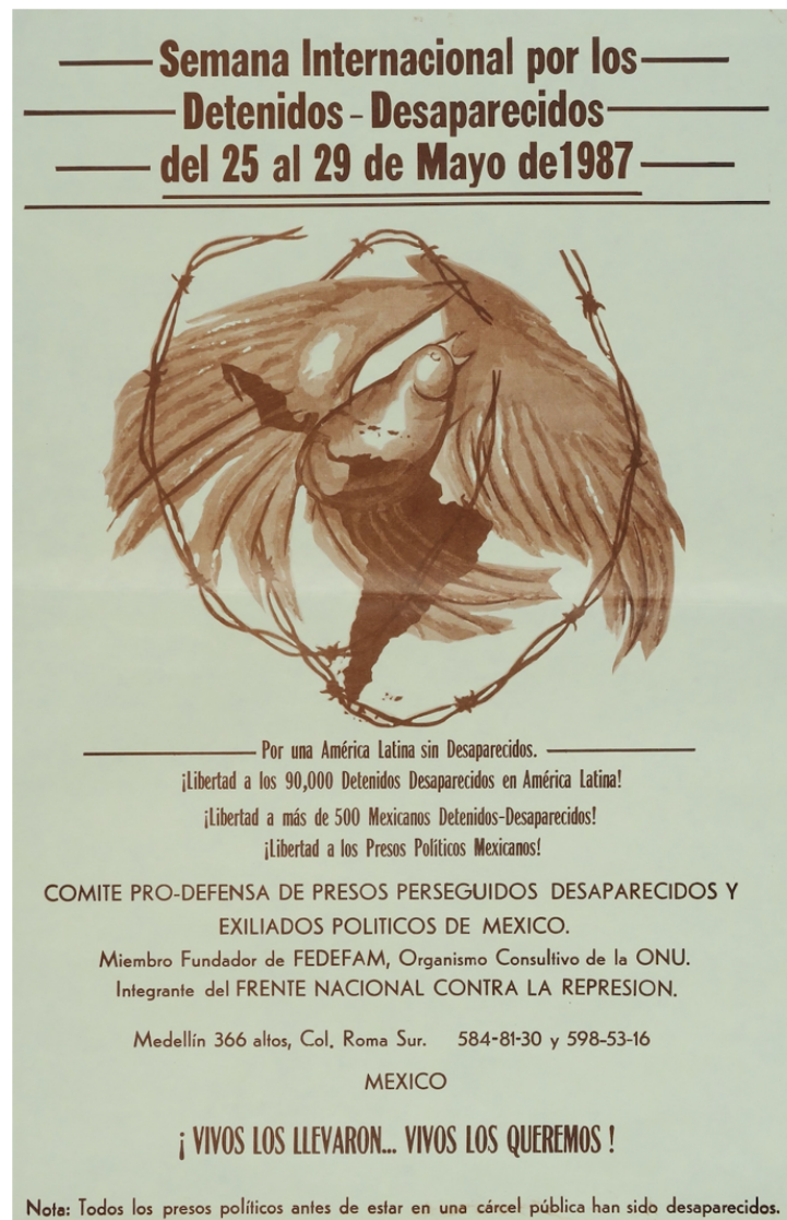
Figura 9. IVb 6639 – “Semana Internacional por los Detenidos-Desaparecidos del 25 al 29 de mayo de 1987”. Año:1987, 44cm x 28cm. Guatemala.

IVb 6639 – Cartel que denuncia la desaparición de personas “Semana internacional por los detenidos. Desaparecidos del 25 al 29 de mayo de 1987”.